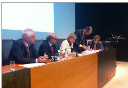
Recuento de los votos en las elecciones de la SEP.